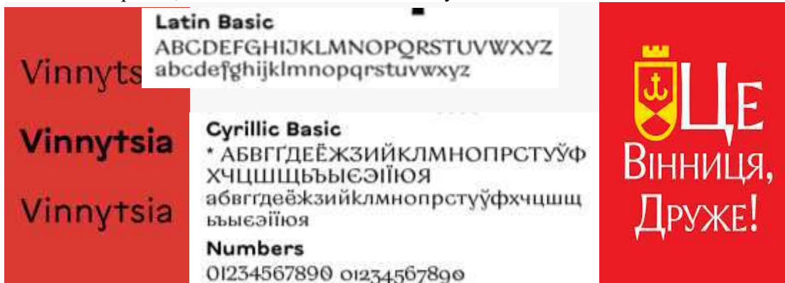
Рис. 1. Зразок шрифту «Vinnytsia Serif» для Вінниці. Автор Дмитро Растворцев [11].

У час військового протистояння потрібно чітко усвідомлювати можливості перевиховування молоді через культурологічні чинники рекламних написів. Бо вони формують ідентичність міста. Реклама є частиною візуальної культури міста. Оригінальні й естетично привабливі рекламні написи можуть сприяти розвитку позитивного іміджу міста, підкреслювати його унікальність і культурну спадщину. Це стосується не лише глобальних брендів, а й місцевих ініціатив та бізнесу.