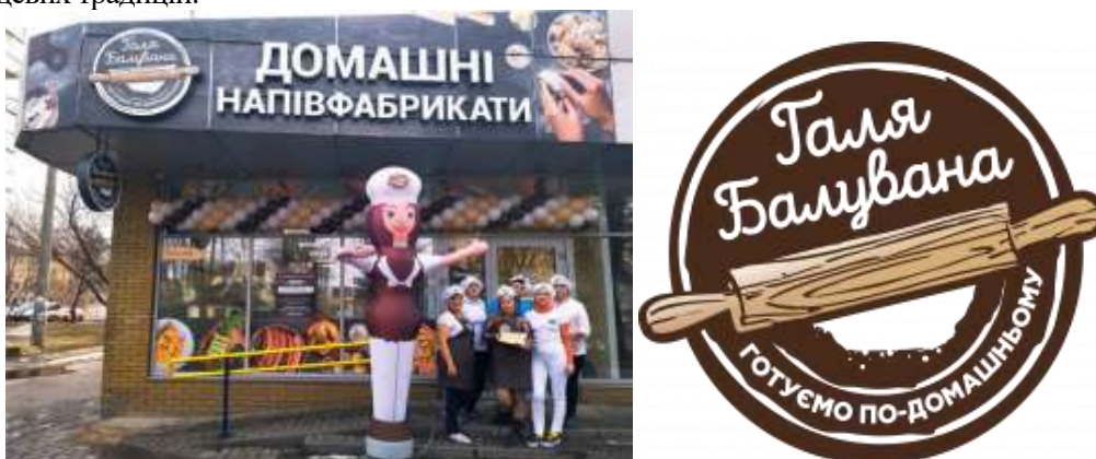
Рис. 5. Реклама напівфабрикатів «Галя Балувана». Місто Черкаси.

Рекламні написи сприймаємо і крізь історичний та культурний контекст, що може бути пов'язано з історією міста, його архітектурою та культурною спадщиною. Вдало інтегровані елементи місцевої історії або культурних символів у рекламних повідомленнях підсилюють зв'язок мешканців із рідним містом, створюючи почуття гордості за свою культуру. Наприклад, використання символіки або мотивів, характерних для міста, у рекламі локальних брендів може стати частиною збереження й популяризації місцевих традицій.