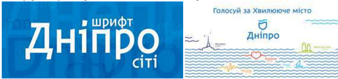
Рис. 4. Зразок шрифту «Дніпро». Автори Андрій Шевченко, Кирило Ткачов [11].

події завжди супроводжуються рекламними повідомленнями, афішами, текстами.