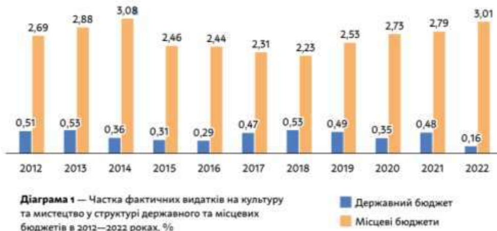
Рис. 1. Частка фактичних видатків на культуру та мистецтво у структурі державного та місцевих бюджетів в 2012-2022 рр., % [15]

Важливо відзначити, що незважаючи на позитивні тенденції в місцевих бюджетах, загальний стан фінансування культури залишається нестабільним. Це створює додаткові виклики для культурних інституцій, змушених адаптуватися до нових умов фінансування та шукати альтернативні джерела доходів. Ситуація з фінансуванням культури в регіонах, які безпосередньо постраждали від військових дій, є особливо складною. Значне скорочення видатків на культуру в цих регіонах відображає загальну економічну та соціальну кризу, спричинену війною. Це вимагає від Уряду та місцевих органів влади розробки спеціальних програм та стратегій для підтримки культурного сектору в умовах кризи. У цьому контексті важливою є розробка комплексного підходу до фінансування культури, який би враховував потреби різних регіонів та забезпечував стабільність та розвиток культурних інституцій. Це може включати залучення приватних інвестицій, розвиток меценатства, а також розробку нових моделей державно-приватного партнерства в культурній сфері. Такий підхід дозволить не лише подолати існуючі виклики, але й забезпечити сталий розвиток культурного сектору.