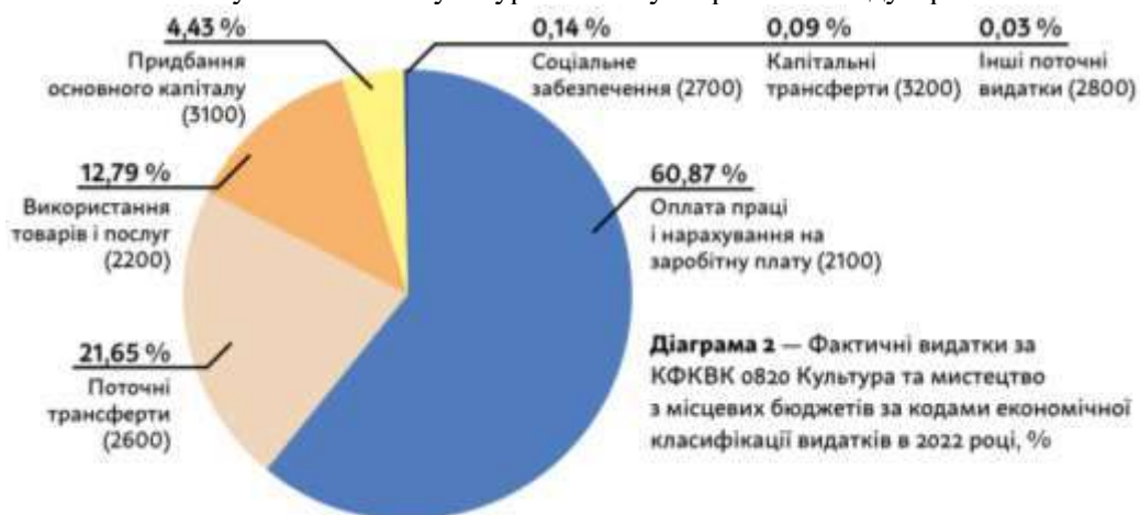
Рис. 2. Фактичні видатки за КФКВК 0820 Культура та мистецтво з місцевих бюджетів за кодами економічної класифікації видатків в 2022 р., % [15]

Аналіз економічних кодів видатків на культуру в Україні виявляє важливі аспекти, які впливають на стан та розвиток культурного сектору. Більшість коштів, що виділяються на культуру, спрямовуються на покриття поточних витрат, зокрема на оплату праці, соціальне забезпечення та поточні трансферти. Це вказує на те, що значна частина ресурсів витрачається на утримання існуючої інфраструктури та персоналу, а не на подальший розвиток чи інновації в культурній сфері. Проблема низької заробітної плати працівників культури, що залишається нижчою від середнього рівня по країні, є особливо важливою. Це створює труднощі для залучення та утримання талантів у секторі, що може негативно вплинути на якість культурних послуг й розвиток індустрії загалом.