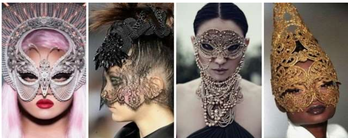
Рис. 1. Приклади використання маски у колекціях от-кутюр ( https://www.pinterest.com/pin/masks--10203536648527913/ )