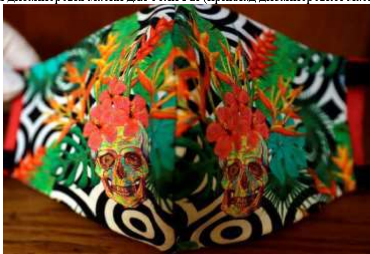
Рис. 6. Дизайнерське рішення стильної маски для обличчя, Чехія, Прага, Національний музей, 2020 ( https://www.csmonitor.com/USA/Society/2020/0603/Face-masks-unleash-creativity-You-can-be-part-of-the-bigger-story )

Пандемія коронавірусу спровокувала появу так званої «вірусної моди» [1] – головним аксесуаром на подіумах стали стильні дизайнерські маски для обличчя (приклад дизайнерської маски наведено на рис. 6).