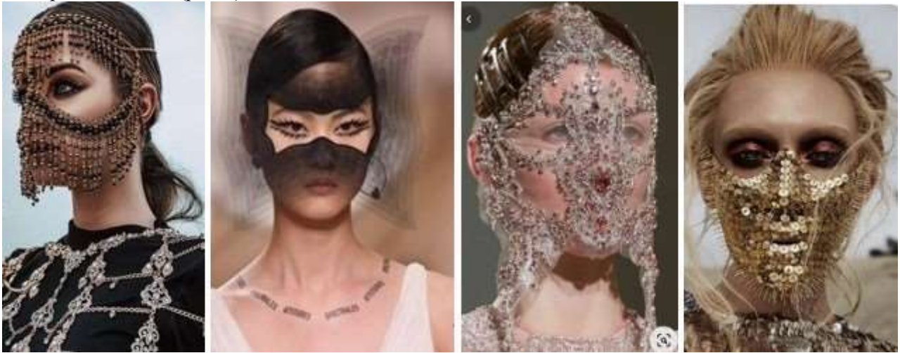
Рис. 8. Маски для модних показів ( https://www.pinterest.com/b_s_hines/mask-for-fashion-show/ )

Багато дизайнерів наслідували їхній приклад, на показах яких на подіум виходили моделі із закритими або напівзакритими обличчями. Як свідчить Л. Дихнич, «останні кілька років на показі Givenchy демонструють маски з мережива з камінням і перлами, які візажисти споруджують на обличчях моделей не одну годину» [2]. Деякі маски у поєднанні з гримом, одягом і аксесуарами є справжнім витвором мистецтва (рис. 8).