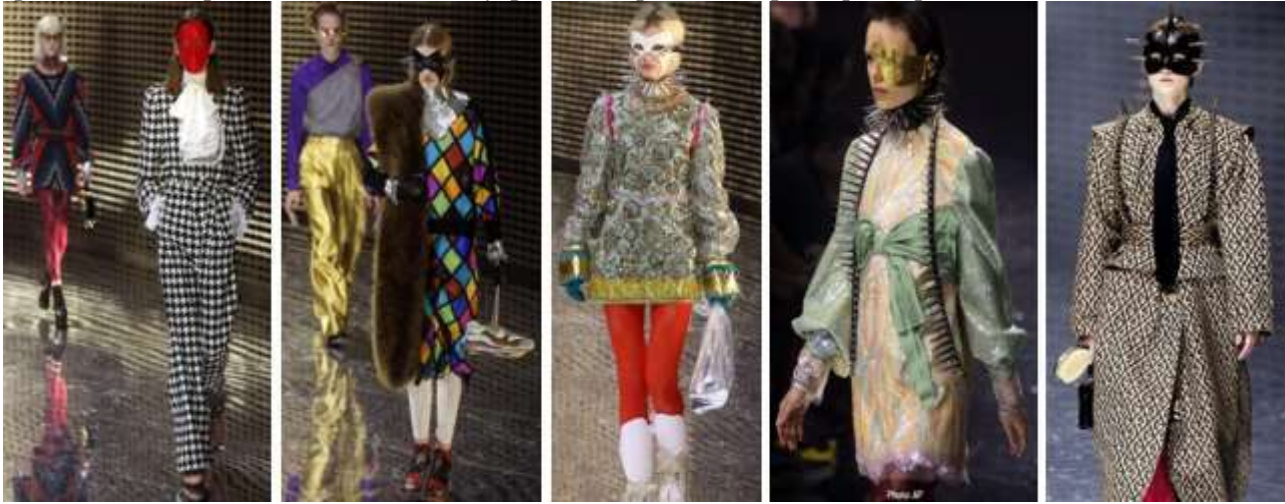
Рис. 3. Milan Fashion Week, Gucci Masquerade (2019) (із колекції) [15]

Зі стилем такої маски гармоніював і подіумний грим, роль якого у цьому образі – бути непомітним на обличчі, створюючи ефект «без макіяжу»: світла тональна основа під макіяж, пастельні відтінки помади тощо. Оскільки маска, в основному, закривала верхню частину обличчя, то практично не використовувався макіяж очей. На рис. 3 наведено фото моделей колекції А. Мікеле у масках різних кольорів, форм та розмірів, які закривали обличчя частково або повністю, водночас гармоніювали із гримом, дизайнерським одягом та аксесуарами, створюючи неординарні образи.