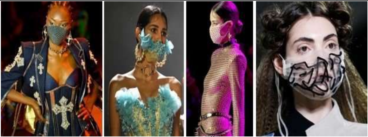
Рис. 7. Моделі у масках на показі Blonds (Нью-Йорк, Тиждень моди–2020) [1]

Багато дизайнерів наслідували їхній приклад, на показах яких на подіум виходили моделі із закритими або напівзакритими обличчями. Як свідчить Л. Дихнич, «останні кілька років на показі Givenchy демонструють маски з мережива з камінням і перлами, які візажисти споруджують на обличчях моделей не одну годину» [2]. Деякі маски у поєднанні з гримом, одягом і аксесуарами є справжнім витвором мистецтва (рис. 8).