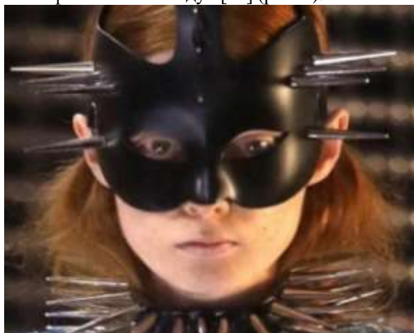
Рис. 2. Milan Fashion Week, Gucci Masquerade (2019) [15]

Деякі дизайнери влаштовують навіть карнавали, зокрема Міланський тиждень моди відкрився 20 лютого 2019 р. маскарадом Gucci, підготовленим креативним директором Gucci Алессандро Мікеле, який представив «еклектичну колекцію Осінь-Зима 2019–2020, багату на кольорову гаму, дизайнерські рішення» [14]. Гаслом програми показу стала фраза «The mask as a cut between visible and invisible» («Маска – це межа між видимим і невидимим»). Тим самим А. Мікеле, поєднуючи маску, грим, одяг та аксесуари, намагався показати, як з їхньою допомогою можна створити екстравагантні образи. «В якості декору для цих речей дизайнер використовував схожі з цвяхами гострі довгі виступи або великі накладки для вух, які надавали моделям ельфійського вигляду» [14] (рис. 2).