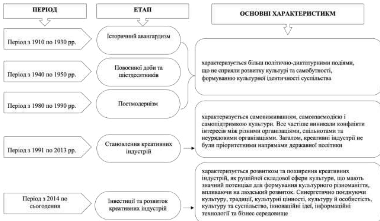
Рис.1. Ретроспектива основних періодів становлення креативних індустрій в Україні, крізь призму культурологічного виміру [Сформовано на основі джерел: 3, 5, 8, 17, 19, 22, 30, 33, 48].

Зауважимо, що становлення та розвиток креативних індустрій в Україні має свою історичну та культурну та специфіку. Проведений нами аналіз дає підстави вважати, що поняття креативних індустрій в українському науковому ракурсі досліджується не так давно. Загалом в історично-культурологічному вимірі розвиток креативних індустрій в Україні слід розглядати крізь призму п'яти основних періодів, як це зазначено на рисунку 1.