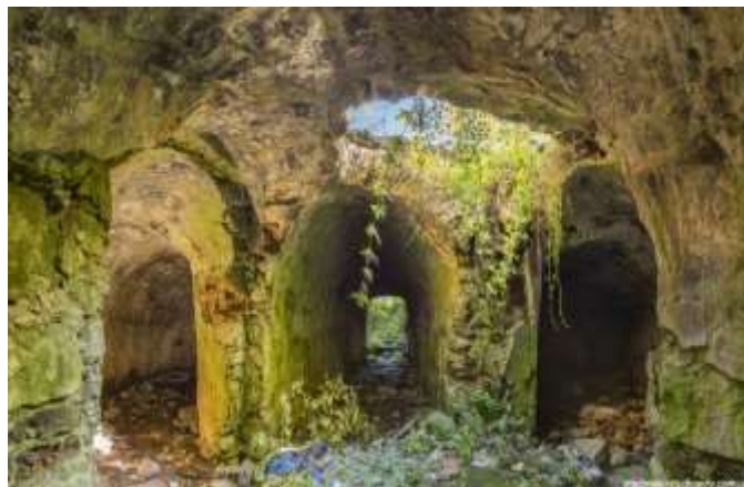
Рисунок 1. – Територія замку Краснодвір (станом на 2019 р.)