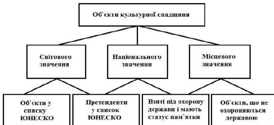
Рис. 3. Класифікація об'єктів культурної спадщини за ціннісним підходом (власна розробка)