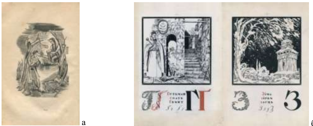
Рис. 2. Книжкові ілюстрації школи бойчукістів: а – О. Сахновська – дереворит до «Лісової пісні» (Харків, 1930 р.) [15]; б – ілюстрації Г. Нарбута до «Української абетки» [14].

Діяльність Г. Нарбута здебільшого спрямовувалася саме на книжкову графіку та визначила її загальні візуальні особливості, притаманні періоду 1920-1930-х рр. Як зазначено в статті В. Олійник [11], дизайну книги того часу було характерним декорування елементів книги яскравими орнаментальними вставками, поєднання національної символіки з геометричними та рослинними мотивами, притаманними низці регіонів України. На рис. 2, б представлено ілюстрації до «Української абетки» Г. Нарбута, а саме ілюстрації до літер «Г» та «З». Композиція ілюстрації до літери «Г» містить поєднання історичної постаті гетьмана П. Дорошенка з елементами геральдики та архітектурними мотивами, що створюють алюзію до доби Руїни – зруйновані мури, похилений вінок на гербі, – а також відсилають до української барокової гравюри. Ілюстрація до літери «З» характеризується використанням негативного простору для акцентування силуету зображення, архітектурних образів західноукраїнської традиції. Так, зображена дзвіниця є характерною до галицької, зокрема лемківської сакральної архітектури. Написання літер до обох ілюстрацій виконане з застосуванням різних варіацій рослинного орнаменту, один із яких зокрема є дещо схожим на петриківську традицію.