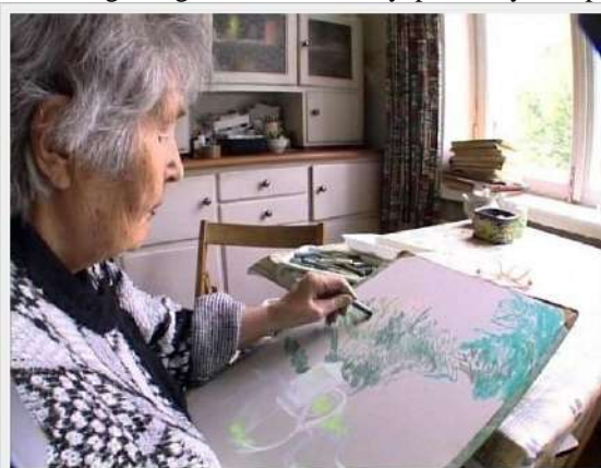
Рис. 1. Світлина. Тетяна Нилівна Яблонська за роботою над пастельною композицією. 2003–2005 рр.

Key words: Tatiana Yablonska, the beginning of the 21th century, pastel, style, impressionism, fine art, creative activity.