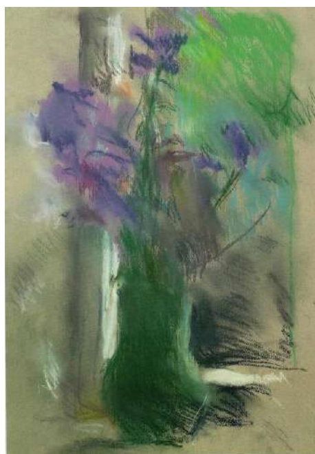
Рис. 8. Яблонська Т. Н. Дзвіночки (Лісові дзвіночки). Папір, пастель. 16 червня 2005 р., день смерті художниці.