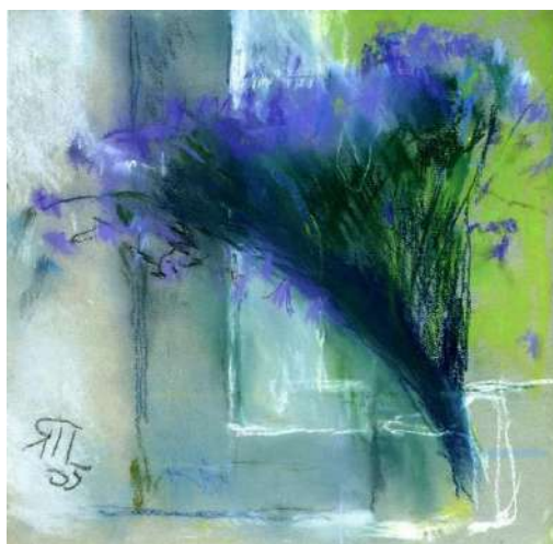
Рис. 6. Яблонська Т. Н. Літо. Папір, пастель. 2005 р.