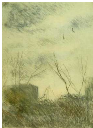
Рис. 2. Яблонська Т. Н. Небо у хмарах. Папір, пастель. 2003 р.