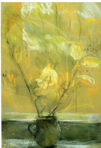
Рис. 4. Яблонська Т. Н. Осінні листя. Папір, пастель. 2004 р.