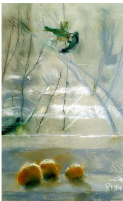
Рис. 3. Яблонська Т. Н. Зимове вікно. Папір, пастель. 2004 р.