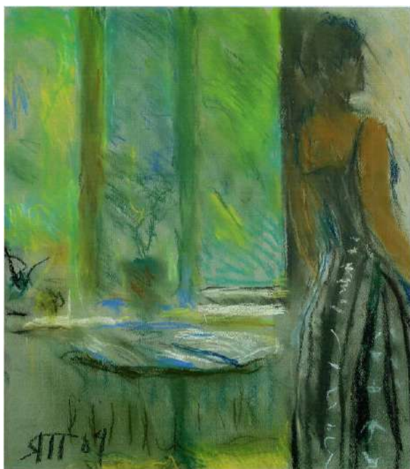
Рис. 5. Яблонська Т. Н. Гаяне та зелене вікно. Папір, пастель. 2004 р.