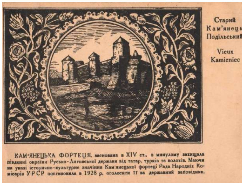
Рис. 4. В. Гагенмейстер. Старий Кам'янець-Подільський. Літографія. 1928 р.

Доведено, що окремі роботи художник виконував з натури, а інші змальовані з фотографій. Світлинами митець користувався, коли пам'ятка була повністю або частково зруйнована, а на знімку можна було побачити її автентичний вигляд. В окремих його композиціях впізнаними є світлини відомих у Кам'янці-Подільському фотографів: М. Грейма, А. Енгеля, Й. Кордиша та ін. [9; 107].