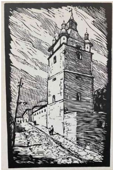
Рис. 5. Гайх С. Кам'янець-Подільський. Вірменський квартал. Оборонна башта-дзвіниця. Вірменська церква (XVI ст.). Ліногравюра. 1965 р.