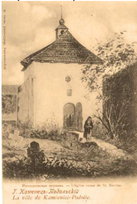
Рис. 1. Я. Грейм Миколаївська церква. Літографія.

Важливим візуальним джерелом, що зафіксувало міські архітектурні ансамблі Поділля – пам'ятки місцевої архітектури й характерні типи мешканців краю, стали світлини видатного польського фотомитця М. Грейма [7], який неодноразово публікував поштівки з видами Кам'янець-Подільського. Значення фото-робіт М. Грейма з видами цього міста полягало в тому, що він розпочав фотографувати історичні та архітектурні пам'ятники в 1865 р. до їх перебудови в 1874–1876 рр. Упродовж 1889–1911 рр. він неодноразово друкував фотографії з видами міста, а у 1901 р. видрукував альбом «Види Кам'янець-Подільського». Митець, крім власних світлин, використовував для друку поштівок картини сина, Я. Грейма «Миколаївська церква» (Рис. 1), «б. Палац комендантів фортеці та Тюрма гарему» [8]. Чимало своїх робіт автор експонував на виставках у Львові (1895 р.), Києві (1897 р.), Варшаві (1900 р.), де їх було відзначено срібними медалями [5; 68].