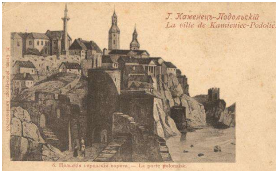
Рис.2. К. Вейрман. Польська брама. Гравюра.